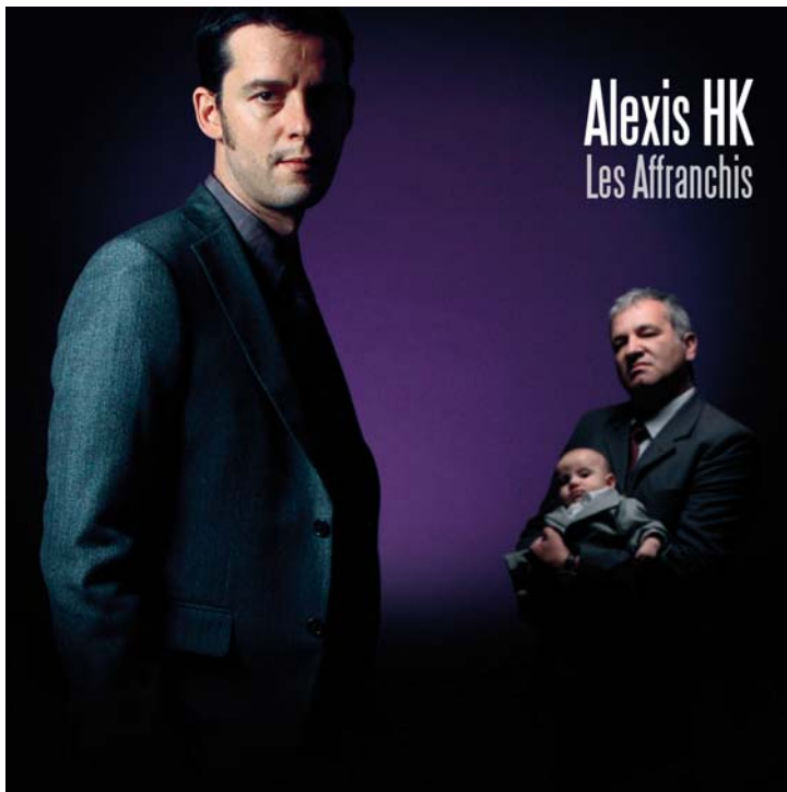
Figure emblématique de la chanson française, avec sa rhétorique subtile et littéraire, son talent de conteur et ses mélodies ciselées, Alexis HK promène son répertoire "rétro-chic" depuis une dizaine d'années. Pour la réalisation de son dernier album, Les affranchis, il s'est entouré de Renan Luce et Matthieu Ballet notamment. « Une réussite, encore, pour un album qui suit la ligne des précédents et remet, avec classe, un chanteur hors pair sur le devant de la scène » evene.fr